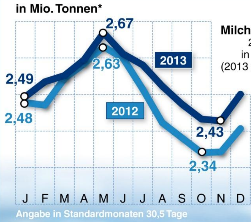
Regionale Milchanlieferung* 2013 und 2012 in 1.000 Tonnen (2013 gg. 2012 in %)